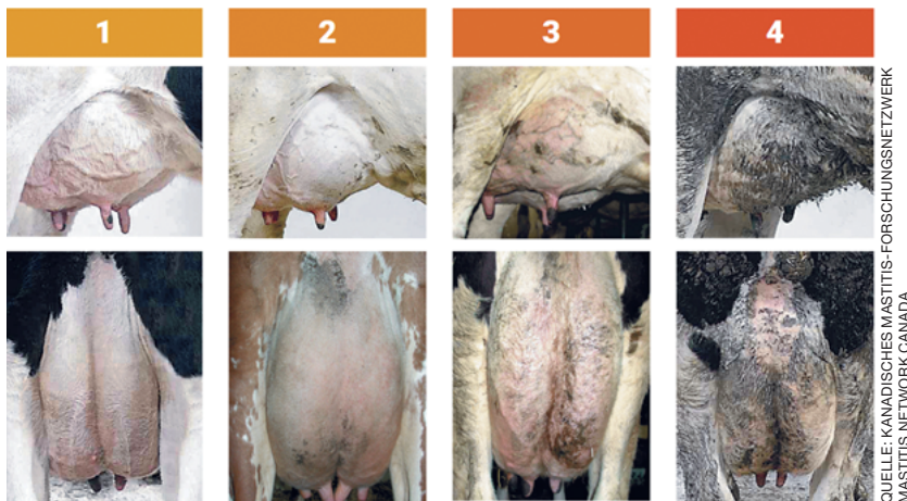
Abbildung 2: Eutersauberkeitsnote

Erläuterung: 1 gewonnener Sauberkeitspunkt bedeutet 50'000 Zellen weniger pro ml.