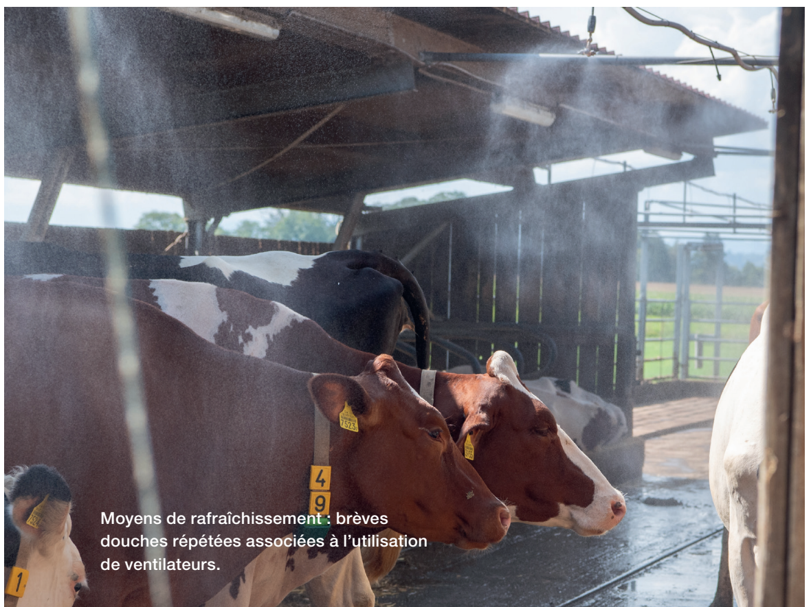
Moyens de rafraîchissement : brèves douches répétées associées à l'utilisation de ventilateurs.