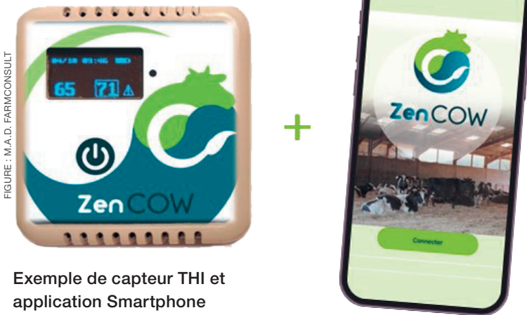
Exemple de capteur THI et application Smartphone

Afin d'anticiper, il existe également des moyens auxiliaires pour vous aider tel que, par exemple, des capteurs de THI (connectés à votre smartphone) à placer dans les aires de vie des animaux. La mesure du THI en temps réel permet de vous alerter immédiatement. Positionner à différents endroits, ils vous renseignent également sur les zones sensibles de vos installations.